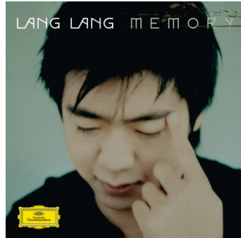
LANG LANG MEMORY DG 00289 477 5976