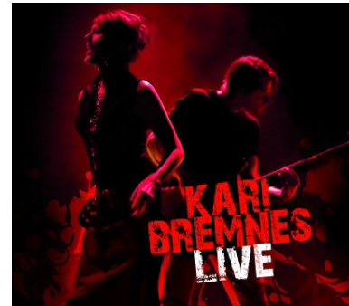
KARI BREMNES LIVE KKV FXCD 321

次試聽的 NEI-3001，訂價直接比 NEI-2001 少了 1 萬，1M1 對為 NTD7,000，如果表現不錯，那豈不是更值得買了。不囉嗦，將 NEI-3001 接在 Audio Research DS200 綜擴與 Bladelius Embla 間，一整天下來撥放各種類型音樂的測試之後，我的心得是 NEI-3001 可說是萬元內，入門 High End 領域的最佳選擇之一，為什麼？以 NTD 7,000 的價格來說，真的是非常超值，NEI-3001 雖然像頂級線材一樣，會有明顯讓人發現的優異表現(廢話，頂級線材動輒數十萬以上當然不是賣假的)，但其各方面的聽感都在水準之上，包括最重要的平衡度、質感與細節等等。如在聽郎朗彈奏的『李斯特—匈牙利狂想曲第 2 號』，NEI-3001 的全頻段頻率就非常的勻稱，如果是下半身過肥的線材，鋼琴踏板的延音很容易就會把後來主鍵的聲音給混成一片，NEI-3001 拿捏的恰到好處，此外 NEI-3001 也保有 Neotech 特有的甜味，但可別誤會，以為是加了蜜的聲音，這種甜味是非常淡且迷人地，若沒有仔細聽根本不會察覺。『KARI BREMNES — LIVE』這張現場收錄的專輯被蔡克信醫師選為本站 2008 年度最佳推薦的唱片之一，錄音極為發燒，KARI 的演唱、鼓手、吉他、Bass、鍵盤手都要很適當的表現整體才會聽起來有“Live”的感覺，再次驗證了 NEI-3001 是非常平衡、定位焦點清楚的。若想要試條萬元以下的訊號線又沒任何頭緒時，請先聽看看 NEI-3001！