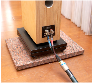
NES-3002 接在喇叭上的情形