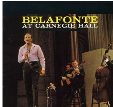
BELAFONTE AT CARNEGIE HALL BMG 74321894852 (SACD)