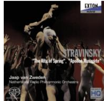
ストラヴィンスキー 「春の祭典」 EXTON OVXL-00007

一點，享受更完整的空間感，只可惜音響室不夠大。換上『陳建年 — 海洋』第 5 軌由卑南族李玉琴演唱的《穿上彩虹衣》，人聲的結像、音場的深度依然出色，尤其是背景自然的流水聲很真實，NES-3002 對細節一點可都不馬虎。那麼 NES-3002 在大動態大編制的表現如何？拿出私家珍藏，價值日幣 22,000 的『荷蘭 Jaap van Zweden 指揮的春之季』，整個氣勢讓雞皮疙瘩都起來了，NES-3002 的低音很沉，速度也很快，而且不免再次要對 NES-3002 的舞台描繪能力再誇讚一番，若是軟趴趴的線材播放春之季可就馬上現出原型。NES-3002 的確又是 Neotech 物超所值的代表作之一，其強調的是真實、動態、能量與速度！。