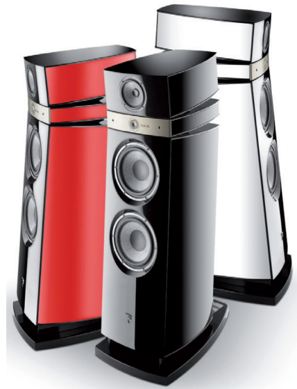
左：代表 CHORUS 826 W 30 週年限量版的雷射雕刻標示 中：MAESTRO Utopia 首次使用兩顆低音單體的設計，單體並使用了 Magnetic Damping System (MDS) 技術 右：MAESTRO Utopia 一樣具有中高低可調整的功能

Utopia EM 一樣的高音，中音，最特別地方在於首次使用兩顆低音單體的設計，這兩顆 11" 的單體作用可是不同，Dominic 特地給我看了 MAESTRO 的箱體內部結構，上面那顆 11" 低音為 40mm 的線圈，並且獨立的空間較小，主要是要求低音的速度(speed)、力道(punch)與動態(dynamic)。下方那顆 11" 的低音線圈為 50mm，其獨立的空間也較大，以求得更低(deep)的低頻。所以一顆主要負責低音的速度，一顆主要負責低音的下潛。兩個低音的箱室間還有設計精密計算的洞，以讓空氣流動，使得兩顆低音雖然主要目的不同，但仍可達成在極低頻率時的一致運動，在技術上其實可稱之為 4 音路的設計。此外 MAESTRO Utopia 的高音、中音與低音一樣可以調整，用家想要調配自己喜歡的聲