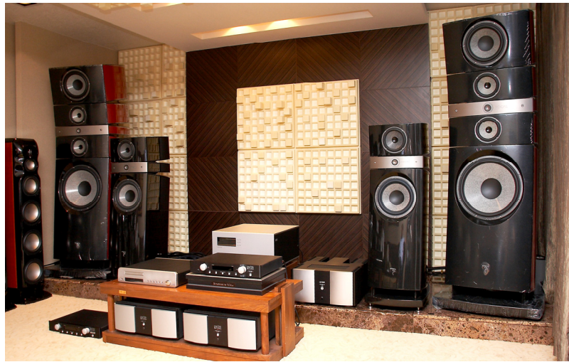
左上：全新的 ELECTRA 的 1008 Be，Be 單體更大了，為 27mm 左下：IW 1002 Be、IW 1003 Be 有專用的 FRAME 可以選購 右圖：凱煜的 Focal 展示非常齊全，當然也包括最頂級的 utopia

Dominic 還進行了 Grand Utopia EM 調整的示範，果然想要什麼樣的聲音，Dominic 都可很輕易的調出來。代理商表示，CHORUS 826 W 30 週年限量版應該在月底前可到臺灣，到時候音響迷就可在 8 月份的音響展一睹其風采了。