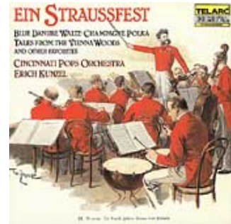
Ein Straussfest / Kunzel, Cincinnati Pops Orchestra (Telarc 80098)

可以不受射頻與 EMI 的干擾。RCA 端子除了符合 75Ω 的標準外，pin 還直接鍍上厚金，這對傳輸上有很大的幫助，NEOTECH 的端子都很好用，緊迫性也足夠，這顆 RCA 端子亦保有這樣的優點。