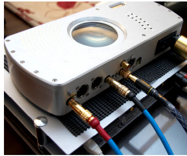
接在 Onix SCD-1 SE 與 Chord DAC64 間