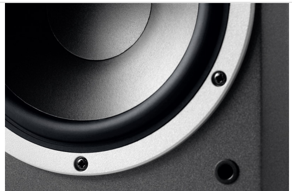
單體裝載在壓鑄鋁框當中