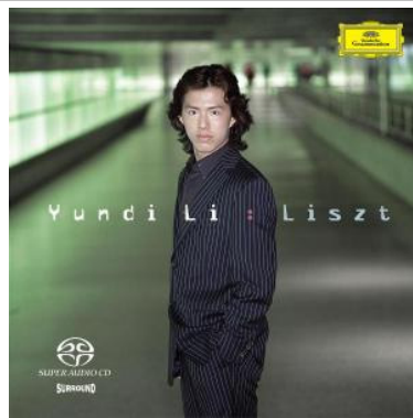
Liszt Yundi Li DGG 474 297-2, SACD