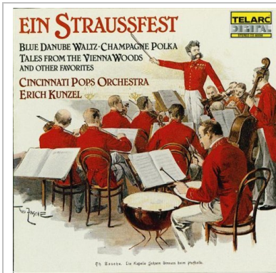
Ein Straussfest Waltzes, Polkas & Marches of the Strauss Family TELARC CD-80098