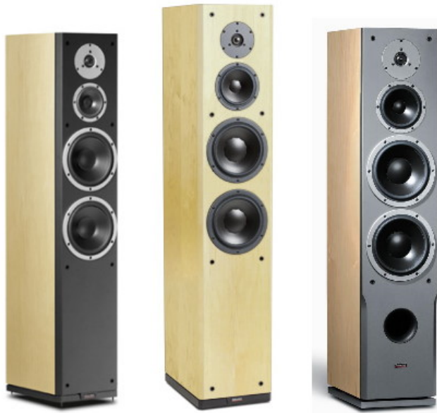
Excite 36 1,040mm Focus 360 1,240mm Audience 82 1,057mm

在前方，Excite X36 與 Focus 360 則在後方，此外看了三對喇叭的效率均只差 1dB，其中又以 X36 最高，的確符合原廠的訴求。