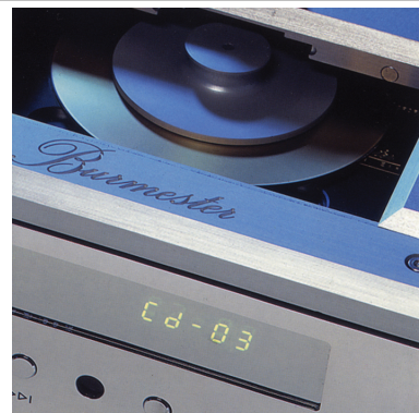
Burmester Sampler CD-03

倒還真沒有辦法取捨，實各有迷人之處。再來聽聽 X36 的低音表現，其並非注重量感而是質感，如果您偏好低頻要有很多的量，那麼 X36 可能不是您要選擇的對象，但若要質，要有層次，則 X36 就不會讓您失望，以『Burmester Sampler CD-03』這張測試片的第 10 軌《鼓詩》來說，X36 可以聽到敲打各種大小鼓的不同，敲打的力道，但在量感上就比較含蓄，也因此 X36 非常適合喜歡落地喇叭的全面性但空間又不大的朋友(我就是一例)。