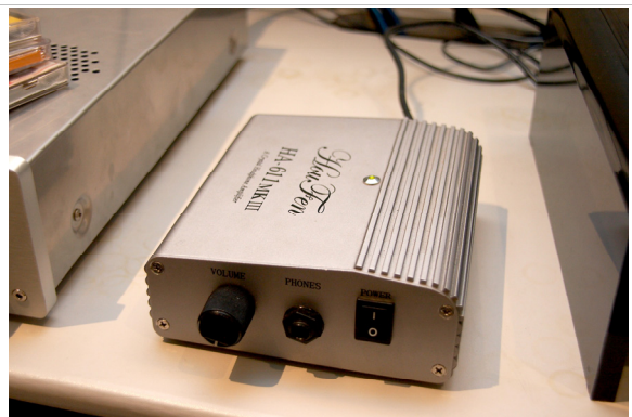
參考機 HA-611 MKIII 600 版

HA-171 在低輸出模式時的背景極為寧靜，聲音也非常純淨，整個頻段非常的平均，不會有某個頻段被強化或是不見，在聽密爾斯提小提琴協奏曲時，小提琴的延伸得以非常完整，不好表達的空氣感亦輕鬆過關。換上 2006 年香港音響展測試片，裡面有著不同類型的音樂，都能忠實的呈現出來，高、中、低層次分明，沒想到其與 HD-650 一搭即合！