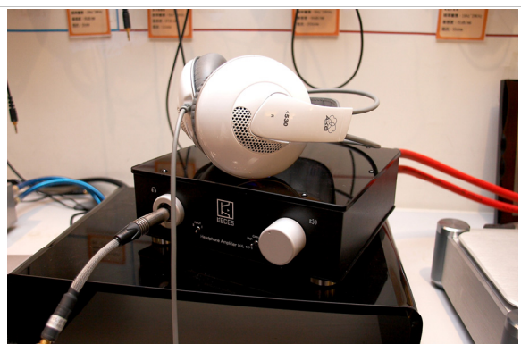
AKG K 530

整體來說，HA-171 的聲音較為平均、中性，但若非常偏好大動態的流行樂、搖滾樂、重金屬或極嗜低頻量感之類的人，在耳機的搭配上則要注意，HD-650 的阻抗 300 Ohm，SPL 102 dB(1 Vrms)，已算是耳機中比較難推的族群，聽貝多芬第九號交響曲合唱第 4 樂章時，HA-171 的撥桿要開在高輸出模式才能有完整的動態、速度與能量，不過此時在質感上會稍為比低輸出模式時降低一些。結束前我試了一下 AKG K 530 這支阻抗較低的耳機，雖然變得較易驅動了，聲音也變得清瘦些。