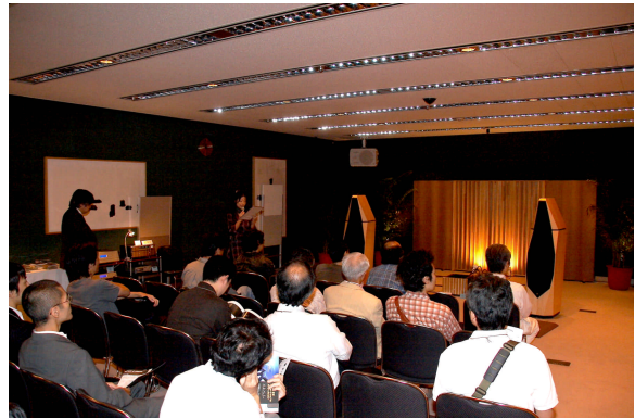
日本東京國際音響展

種弧度，可是花了我們不少的心血，為了配合這種弧度，每個按鈕背後的長度也都要不同，這都是要非常精準才有辦法。另外遙控器的設計也是非常的特殊。此外，顯示螢幕的解析度也非常的高，高達 32x300 畫素，是接近一種白色的顏色，相當的清楚。