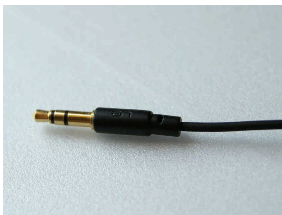
3.5mm 接頭為 iPhone 可用的細版接頭