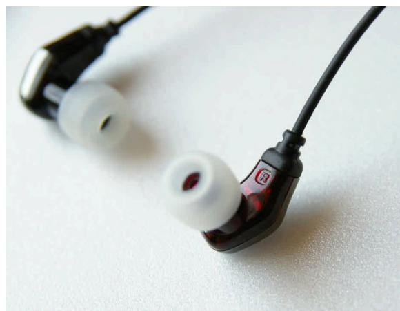
左右耳(L、R)的符號，使用音響常見的顏色來區分，右邊是暗紅色設計，左邊則為黑色

首先，在外型上，不得不佩服 UE 的設計團隊，簡單曲線就勾勒出視覺上的協調造型，表面再採鍍鉻處理，形狀角度拿捏的十分恰當，所以不論是直接佩帶或是反勾繞耳，一眼望去都巧妙的與耳朵結合，內部採半透明的處理，就如同 metro.fi 150 一樣，表面除了 UE 字樣外，看不到左右耳(L、R)的符號，使用音響常見的顏色來區分，右邊是暗紅色設計，左邊則為黑色，也因為半透明的關係，所以質感顯得生動許多，耳塞部分除了常見的大中小之外，也增加了 COMPLY 為 UE 做的 T-series，3.5mm 接頭為 iPhone 可用的細版接頭，雖然在台灣即將上市的 iPhone 3G 但是由於取消了原本的接頭內凹設計，但是國外舊版 iPhone 的用家數量十分龐大，瞧見多家耳機廠商改版或推出適用機種即可見得。super.fi 5 未來將推出 v 版本配合 iPhone，內搭載麥克風與按鍵可操控播放時的音樂