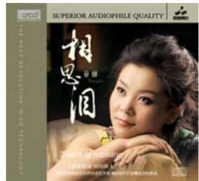
童麗 相思淚 妙音唱片 WMXRCD-003