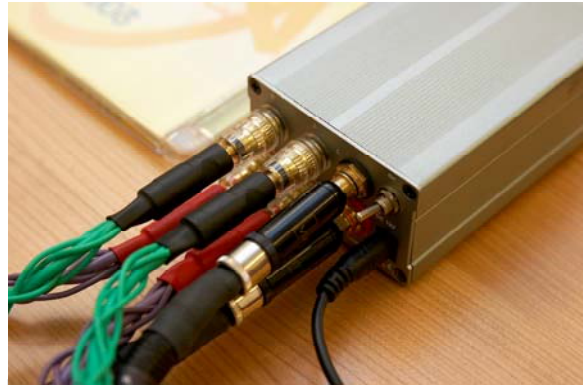
記住不要用太大的端子

第一次使用這麼小台的擴大機還真不知如何下手，果然在接喇叭線與訊號線時都出現了一點困難，由於原本 VOVOX 喇叭線一端使用的是 WBT -0681Ag Y 型端子，要插在 TA-10.1 背後緊密的端子座上根本不可能，好在後來還有一對正在試聽中的 ESTI ZXS 965 喇叭線，使用的是香蕉插才解決了問題，audioplan UIC 88 A 訊號線搭配的 WBT-0152 Ag 純銀端子似乎也不太插得進去 RCA 座，最後有點勉強地接全部接好！