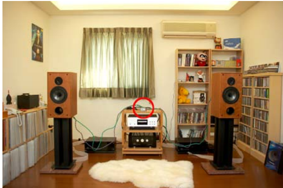
忍不住再說一次，TA-10.1 真的很小

試聽時搭配的是不算難驅動的書架喇叭— Spendor G455 (也就是 SP2/3R)，效率有 88dB、訊源為 Esoteric X-05。TA-10.1 一開聲就完全把我給嚇到了，原本以為只有 15W 的功率應該是無法將 Spendor G455 驅動的很好，但顯然地我必須即刻修正這樣先入為主的觀念，TA-10.1 不但推力十足，動態對比與細節一點都不馬虎，完全不會軟腳，重點是在相對不算小的空間中，音場可是綿密著充斥著整個音響室當中。