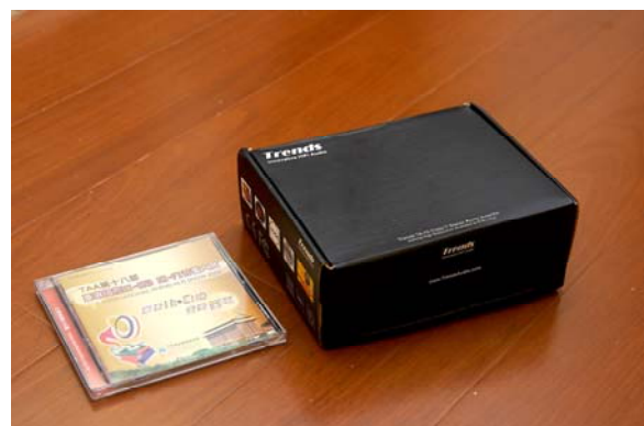
整個包裝居然只比 CD 大一點而已