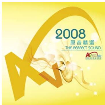
THE PERFECT SOUND 2008 原音精選

『2008 年原音精選』與『瑋秦校聲』這兩張專輯裡面有許多曲目對擴大機的推力是有著不小的考驗，TA-10.1 在這方面表現的是可圈可點，跟同級或是再上一級的擴大機比