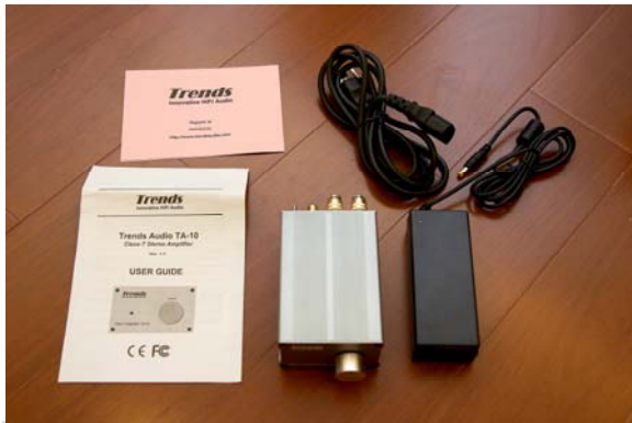
TA-10.1 本體、變壓器(國際電壓 100~240V)、

Trends Audio 成立於 2006 年，是港商 ITOK Media Limited 旗下的新部門，專門製造 Hi-Fi 的產品，目前 Trends Audio 共出了兩樣產品，一個就是這次要介紹的 TA-10.1 擴大機，另一個則是剛發表也非常有趣的 UD-10.1 USB Audio Converter，可透 USB 與電腦連接後，提供高品質的數位訊號輸出到 DAC。