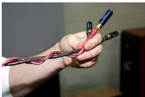
「Dual Micro Mono-Filament」的舉例說明：黑色的為導體，兩條紅色的就是 FEP