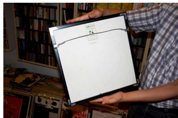
傳統的掛框光拆這些螺絲就要半個小時了