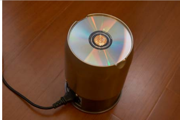
將 CD 印刷面朝下放在網子上

Blu-ray 等光碟放上去，按下電源開關旁的紅色按鈕，內部的電風扇就會作用 14 秒後自動停止，為什麼是 14 秒？我想原廠有實驗過這是擁有最佳效果的時間了吧！