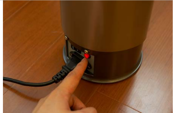
按下紅色按鈕後，內部風扇就會運作 14 秒後自動停止