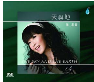
陳潔麗：天與地 雨林, H-133

「LEONARD BERNSTEIN: Rhapsody in Blue」編制場面較大，在經過 RIO-5 II 處理後，舞台的層次與立體空間更為清楚，難得的是，試聽到這，沒有察覺到缺點出現，為了做最後的確認，較平常多安可了 1 首「陳潔麗：天與地」的《漣漪》，上半截也是讓人突然有豁然開朗、重見光明的自然延伸。