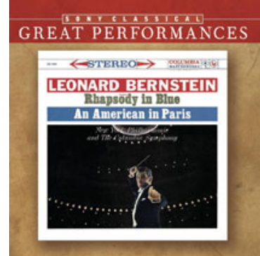
LEONARD BERNSTEIN: Rhapsody in Blue SONY, 82876 78768 2

「三國」，整張專輯就是以三國故事為主題，從第 1 首描繪亂世圖景的《亂》到最後第 12 首《三分歸一統》首尾呼應，XRCD 版本為日本 JVC 及德國老虎魚進行後期製作，除了音樂非常好聽之外，音效更是驚人，為了讓試聽更為有趣，直接就跳到第 2 軌描繪短兵交接的《長坂坡》，在經過 RIO-5 II 處理後，感覺蠻正面的，不過還言之過早，換上「LAUREN WHITE AT LAST」第 3 首《BLUE BAYOU》，變化開始出來了，CD 在經過 RIO-5 II 處理過的聲音就像系統上原本被遮上一層的面紗，現在給拿掉了，尤其在上半截的頻率更是明顯，或許在缺少負離子的情況下，高頻受到的影響最為嚴重，不過這純屬個人的聽感。