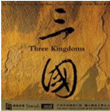
三國 瑞鳴, SWS-0064