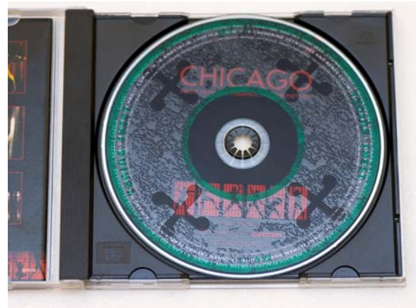
記得貼上後，要用手再鋪平一下，把多餘的空氣排出去

究竟在自己系統上聽起來的效果如何呢，有沒有像在鑑賞會有這麼驚人的效果？我想這回合在試聽下來，答案是肯定的，一般使用調音道具有時會讓整體的音域平衡性受到影響，不過很高興的是 RF-11 並沒有這種傾向，更重要的是細節明顯的更多了，這是非常棒的一件事情，因爲這可以讓音樂的感染力更好！好了，這下代理商的策略成功了，因爲我已經想買一包試試其他的 CD 效果如何，反正如果以後不想用(機會不大)，