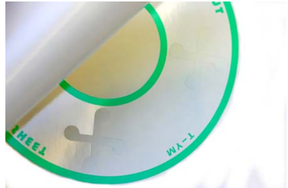
RF-11 是塑膠的材質，厚度 0.18mm，除了中間的洞外，3、6、9、12 點鐘分向各有一個十字架的空洞，是木內和夫先生調音的秘方之一

來測試會比較好呢？在經過考慮後，最後選了 Chicago 電影原聲帶的 SACD 版本來做測試 (Epic/Sony ES 87018)，所選的曲目是第 13 軌的“Nowadays/Hot Honey Rag”，會選這張專輯的原因也很簡單，如果有看過這部電影或是看過 DTS Demo #8 示範片的話，對這段由 Catherine Zeta-Jones 與 Renee Zellweger 兩位女主角的表演一定會印象深刻，音響系統重播的感染力有多少是測試時的關鍵。