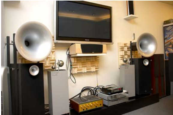
視聽室左方展示較高等級的系統