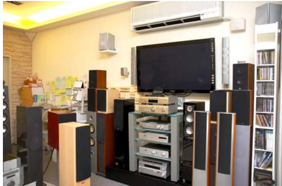
視聽室右方展示一些入門的系統