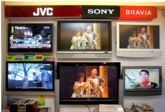
現場提供多台電視方便直接比較