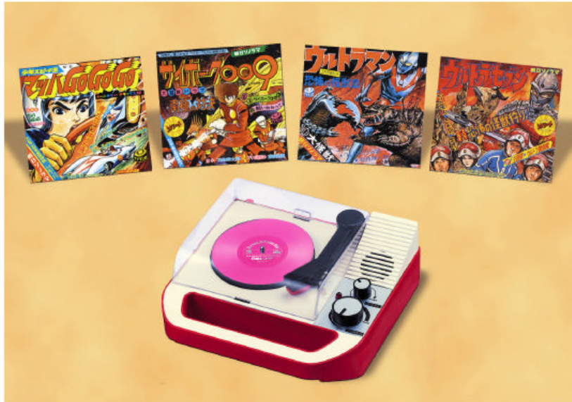
写真：「8（イト）盤レコード」と「8（イト）盤レコード専用ポータブルプレイヤー」