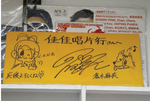
倉木麻衣非常可愛的簽名，佳佳唱片的日系產品果然非常厲害。

在將近3個小時的訪談過程當中，不斷的發現有客人會直接詢問佳佳唱片的服務人員想要找片子，神奇的是，每一位員工都可以非常快速與直接的作出回答，好像都不用思考一樣。這就是佳佳唱片最大的資產：人。每一位在佳佳唱片工作的員工都具有相當的資歷，對自己負責的領域都相當專精：包括古典部的林小姐、日文部的黃小姐、影音部的賴小姐、國語部與韓語部的唐小姐，當然還有西洋部的忠哥及發燒部的老闆娘。要留住好的人材是相當不容易的，佳佳唱片是如何做到的呢？答案就是將心比心，佳佳唱片要讓在這裡的員工都能很放心的享受工作樂趣！