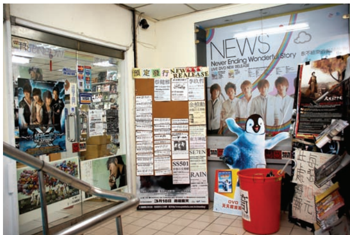
位於佳佳唱片入口外的告示排以日本即將發行的專輯為主。

因此委託佳佳唱片幫忙代訂，雖然價格差不多，但不用自己承擔交易風險，東西有問題也可以換，有時候買不到的，透過佳佳唱片近30年來所建立的管道，反而會很輕鬆的就買到了，當有想要比較特別的唱片時，不妨多多利用佳佳唱片代訂的服務，一般來說，國內有的約2-3天內就可到貨，國外則不太一定，但至少非常安全。