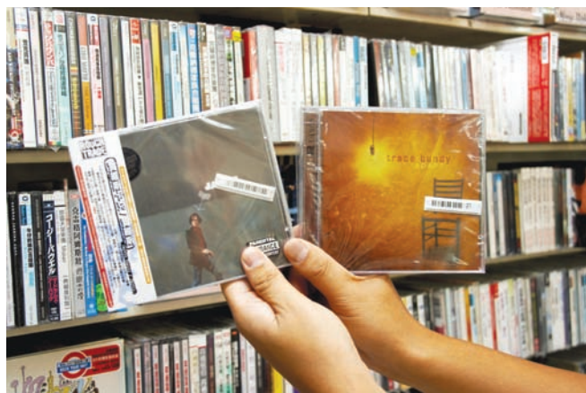
忠哥所推薦近來常聽的兩張專輯：左邊那張是唱腔非常特別、英式搖滾風的賈維斯卡克同名專輯；右邊則是佳佳唱片獨有，缺貨好一陣子TRACE BUNDY的ADAPT專輯，出神入化的吉他獨奏與點弦技巧是忠哥主要推薦的原因。

當然音樂的商品實在是太多了，加上無論是唱片製作公司或是代理商越來越都不願意增加庫存的數量，很多唱片不是沒進，就是數量很少，甚至是賣完一批就沒有了，因此除了店裡的商品盡量齊全外，代訂服務一直是佳佳唱片主力的服務項目之一，從1990年左右就開始了。代訂的區域包括了日本、德國與美國等地的音樂商品。