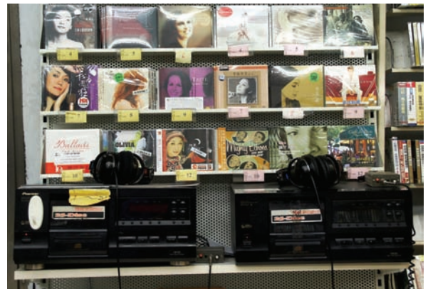
提供熱門發燒片試聽的服務