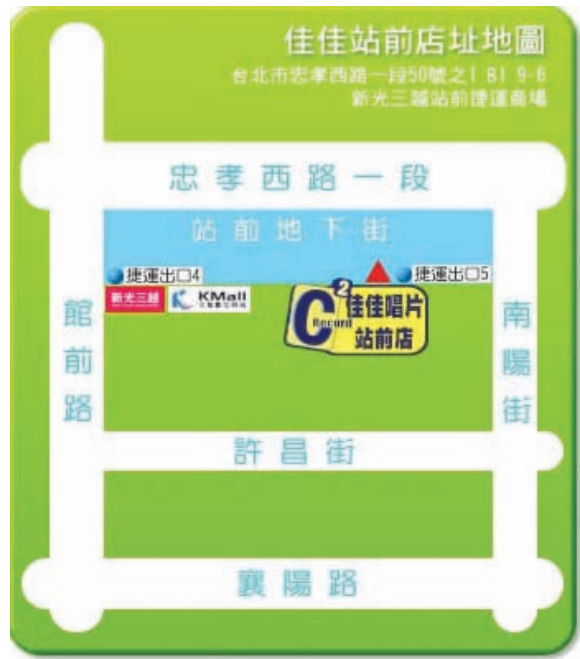
站前店 位於捷運台北車站的地下街，靠近捷運的入口，對於捷運族可說是非常方便