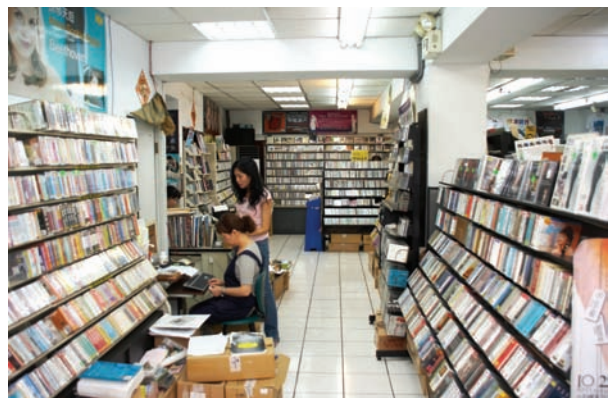
B區最裡面的一排，有爵士、歌劇等相關的產品