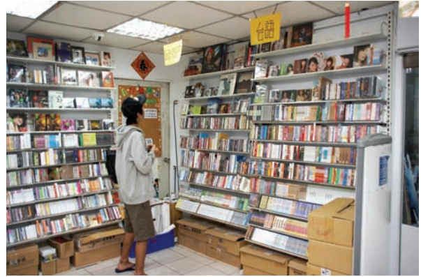
入口的右手邊為閩南語及國語的部份