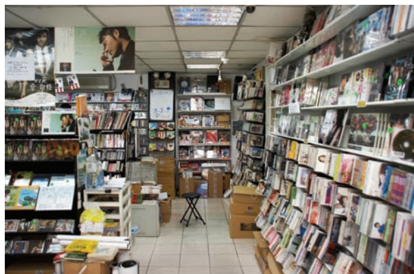
韓語區在A區的角落