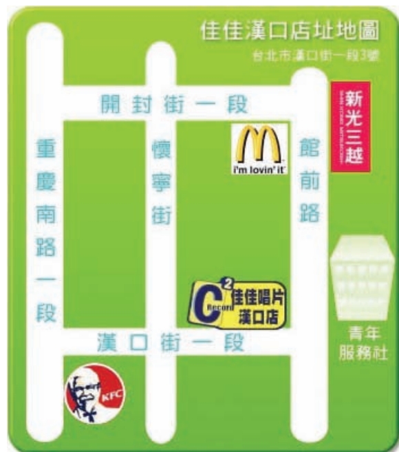
漢口店 日系與地下樂團的商品為主要特色