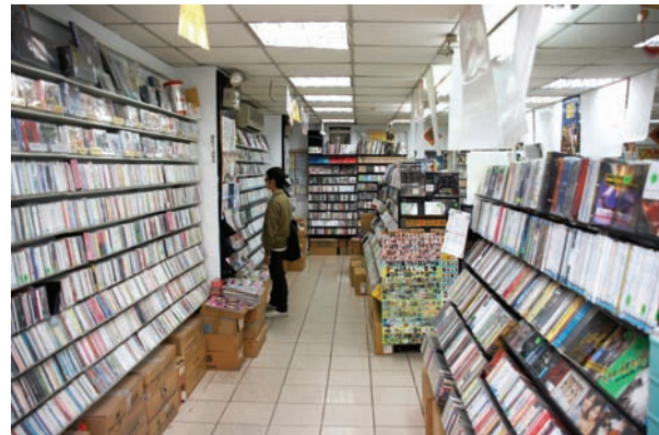
日語部，最靠近櫃台的那一長排，包括原裝進口的CD或DVD，當然也有臺灣代理發行的，在貨的數目應該是全臺灣屬一屬二的