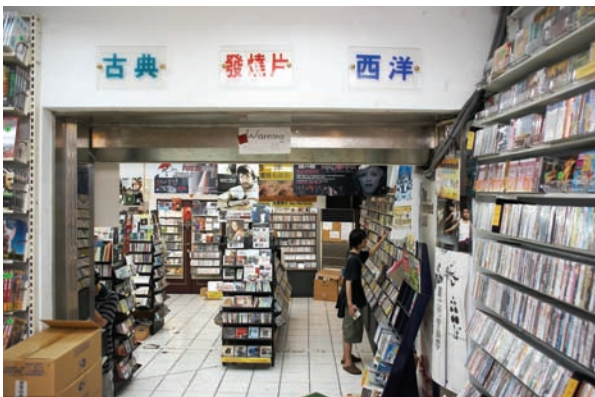
B區主要以古典、發燒片與西洋為主