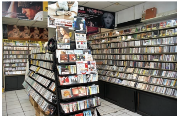
一進B區正面就可看到數量非常豐富的西洋區