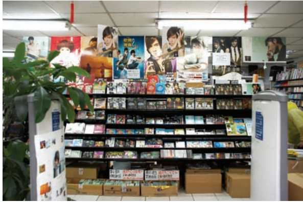
一進門最先看到的就是最近發行或熱門的片子