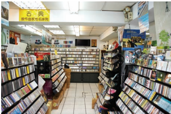
B區中間走道，除了發燒片外，有部份的西洋與古典的樂器類