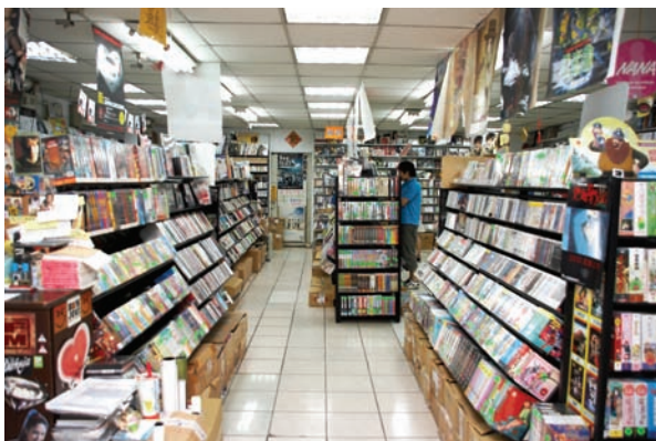
A區的中間那排，左手邊為廣東區，右手邊為卡通、國樂，心靈音樂等