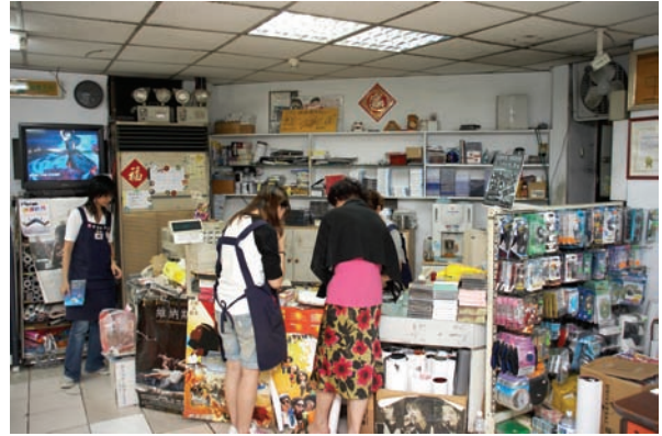
櫃台，也有一些影音配件可以選擇