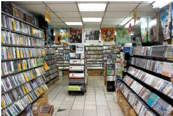
入口的左手邊均為影片區，種類也相當齊全