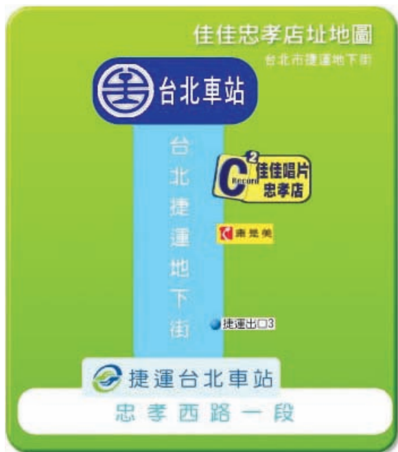
忠孝店 位於捷運台北車站的地下街，跟中華店差不多大，約60坪，靠近台鐵的出入口，鐵路族為主要消費族群