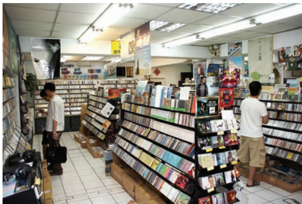
B區進入後的左方，以古典與發燒片為主