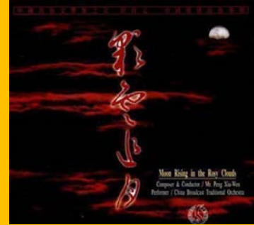
(彩雲追月 中國龍 JRAF 2061) 大樂團版本的關山月，錄音也很不賴

本曲為漢代古樂府曲，此處將唐代詩人 李白的同名詩填入。既為古樂府曲，用於朝中演奏，曲式中正和平，演唱與前軌漁舟唱晚為同一人。若在心情不佳時聆聽此曲，有撫平情緒之效。