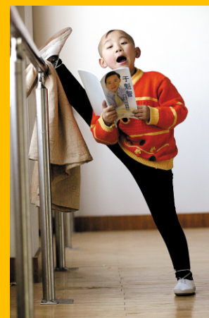
小陶陽練唱檔案照