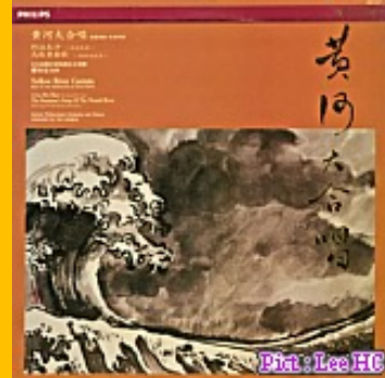
(黃河大合唱 Philips 4220131) 除曲名外無太大關連，但朗誦樂段與曲中感染力差可比擬。

“君不見 黃河之水天上來…”這篇李白的千古名詞大家應該都聽過，在孟慶華先生巧妙的編曲之下，並由京劇名角 關棟天演繹，將詞中的狂放顛嘯詮釋得淋漓盡致！歌者聲底清亮醇厚，感染力奇佳！音樂起始的古箏下行音階搭配笙的和弦襯底真讓人有黃河之水天上來的畫面，而歌者的驚天一句，更將曲子的氣勢拉抬到最高點！中間一段朗誦部分，僅有古箏襯底伴奏，但韻味十足，將詞中的癡狂展現得充分淋漓。