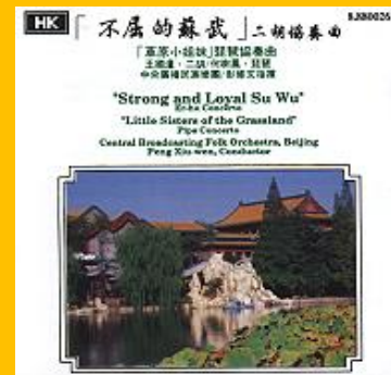
(不屈的蘇武 HK 8.880026)

純國樂版的二胡協奏曲，採用相同的蘇武牧羊曲調，二胡的蒼勁、樂團的悲壯、放羊 19 年誠意推薦！