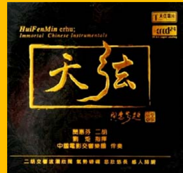
(天弦 天弦唱片 TX-XR24) 江河水二胡版代言人：閔惠芬老師發燒決定版

『鋤禾日當午，汗滴禾下土；誰知盤中飧，粒粒皆辛苦』。這首大家從小就耳熟能詳，被長輩拿來告誡要珍惜糧食的詩，沒想到也經過譜曲後收錄在這張專輯中。值得一提的是本曲演唱者是年僅九歲的京劇神童 陶陽，他的演唱中氣十足，以童聲老氣橫秋地使用京劇唱腔演唱，實在堪稱一絕。但可能年紀尚小，與大樂團合作經驗較少，演唱又是新曲子，跟樂團的搭配上仍有磨合的空間。