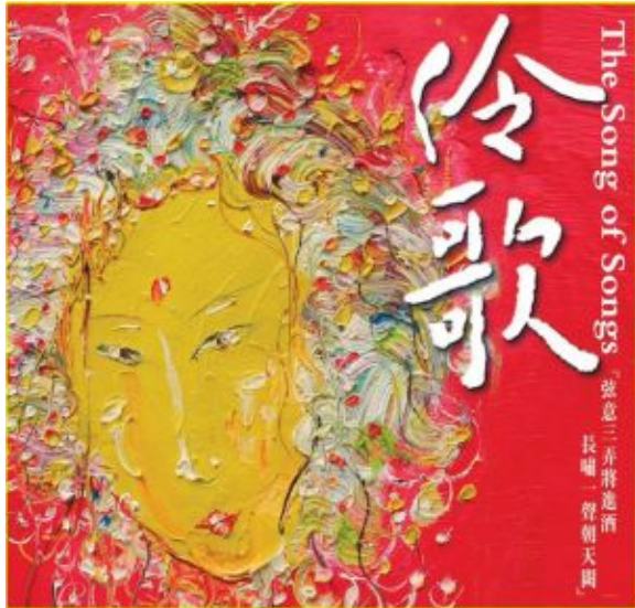
專輯：伶歌 編號：瑞鳴音樂 RXRCD-008

相信聽過或看過這張專輯的人一定會對這標題感到疑惑，明明這張專輯就是邀請戲曲界名伶搭配樂團演唱中國傳統歌曲，何來【超越兩千年跨界】之有？當答應版主要寫這張專輯拿到手放入CD播放後，心中不禁暗道”慘了！”這專輯或許以一般音響評論的角度寫很容易描述：錄音發燒、空間感好、各種樂器的形體描述得極佳，喜愛傳統中國音樂的朋友趕快跑步去買！頂多認真點再加上各曲內搭配之不同樂器及歌者唱腔的描述。