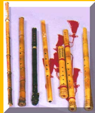
圖中是各式不同調性的蕭，文中提到的秦蕭是最左側那把，明顯與其他蕭家族的外觀不同。

本曲為著名箏曲，曲名取材自王羲之的滕王閣序，描述傍晚至入夜於觀看湖上漁舟旖旎的景致，由程派青衣名伶劉桂娟演唱。本曲女聲雖聽似軟語呢喃，但實際內力十足，若播放的聲量較大，唱至樂曲中段若遇到控制力不足的系統，人聲可能會悶住或是爆音。可作為測試系統控制力之用。