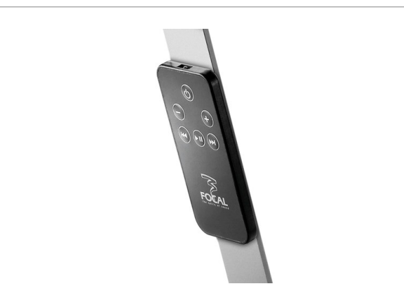
遙控背面有磁鐵所以會吸在左右喇叭的金屬架上

首先說明一下 USB 音效喇叭的用途，如家中電腦是使用跟機音效卡，所謂跟機音效卡就是買回來只有 3.5mm 耳機輸出的電腦；或是組裝電腦還沒購買音效卡的用家，這種含 USB 輸入解碼的喇叭，解碼處理一般都比跟機的音效卡要好很多，甚至比很多另購