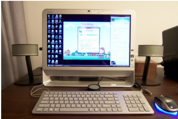
上圖：Bose 的 2.1 電腦喇叭，也是內置 DAC 設計 右圖：Stello DA100 Signature DAC(可接 USB)與 Stello HP100(前級)

腦 USB 輸出到 XS 比較好，這時大家會想，Apple 產品的用戶，歌曲檔案本來就在電腦裡，既然有接電腦那直接就用電腦播就好了，那 Focal 還做個座插 iPod 幹什麼，事實上 iPod 太流行了，如果有朋友帶來他的 iPod，直接插上去就可以享受音樂了，以我的印象，Focal XS 的音質已比大部分透過耳機線或是原廠座接的床頭音響效果好上許多。