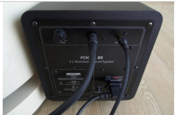
簡易的接線：訊號線一條接左、一條接右、再接上電源線就可完成