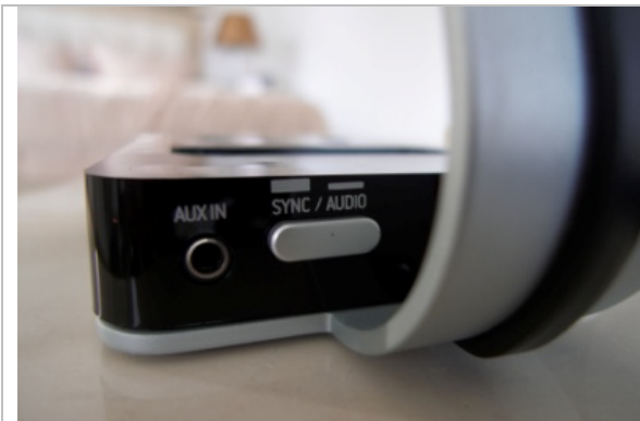
耳機插座/切換同步跟聆聽模式

先看看 XS 比較特別的地方：1. 可取代電腦音效卡，直接用 USB 連接到 XS 系統解碼，提升音效；2. 可與 iTunes 同步，同時代表可以省去另一條連接線；3. 與 iTunes 裡的時鐘同步，可達到更精準的聲音，這也是說用 iTunes 播放時會比其他播放軟體來的好聽；4. 不需開電腦，iTouch、iPod、iPhone 可直接插入播放；5. Focal 有付遙控器可替代原廠的，含 On/Off、Volume、forward、backward、Play 等按鈕。