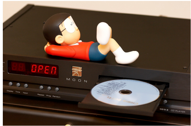
聽 CD3.3 時的心情就像這樣，非常舒服輕鬆。

在內部線路與用料方面，Simaudio 使用自己研發的傳動系統，包括軟體，為了解決傳動系統運轉所產生的振動問題，CD 傳動系統下方使用了 Simaudio 獨家研發的「M-Quattro suspension」技術，讓其與 CD 機本體連接，並使用一種膠質物進行緩衝。左方可看到一顆藍色 Simaudio 自行研發的 25VA 低噪音環型變壓器，作為數位與類比的電源供應，電源電容一共用了 198,000 \mu F。DAC 晶片為 BurrBrown PCM1798，可支援到 24-bit/192kHz，8 倍超取樣(oversampling)的數位濾波，內部線路並升頻至 24-bit/1.411MHz，所使用時鐘的精準度高達 25PPM，線路板也不馬虎，使用純銅的線路並鍍金，擁有更低的阻抗，數位與類比的線路也很清楚的分開，以求得最短的訊號路徑及避免線路交互干擾。