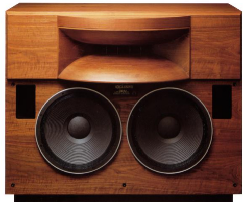
Exclusive model 2401 twin

目前全球有超過 20 個國家、300 個地點以上的專業錄音室、電影院劇場及大型演唱會系統都一致採用 TAD 的產品。如導演喬治盧卡斯的 Skywalker Sound (USA)、皮克斯動畫公司 Pixar Animation Studios (USA)、華德迪士尼 Walt Disney Production (USA)、日本 NHK (Tokyo) 此外，每年負責評審“奧斯卡金像獎”頒獎典禮的“美國影藝學院”(Academy of Motion Picture Arts and Sciences)的 Linwood Dunn Theater 亦指定採用 TAD Cinema Speaker。