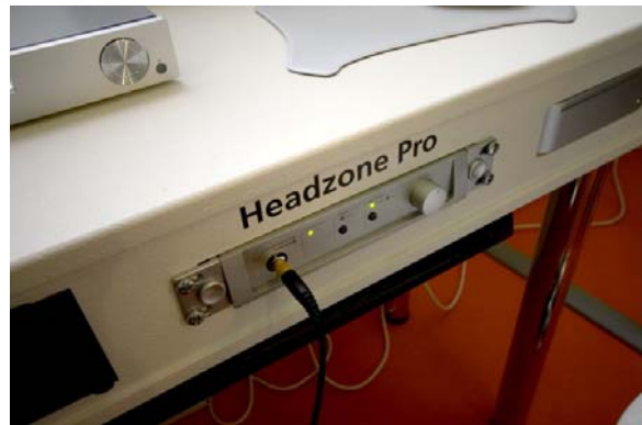
2007 年慕尼黑展出的是 Pro 的版本