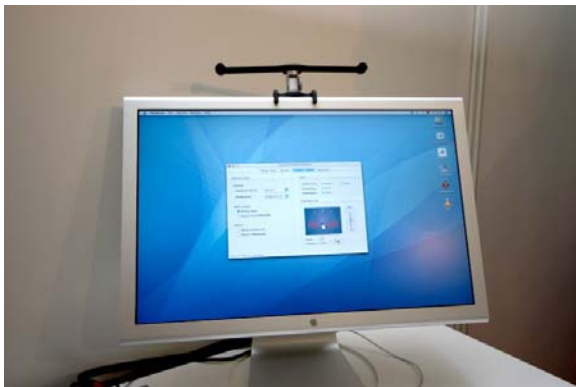
Headzone 位於螢幕上的感應器

HEADZONE 為具有環繞效果的耳機系統(Surround headphones)，並分為家用(HOME)與電腦遊戲(GAME)用的兩個版本。其主要的特色就是配有獨家專利的感應偵測功能(Headtracking Function)，隨時將使用者的位置資訊傳輸到專用的處理器當中(Headzone Processor)，當使用者不面向螢幕時仍可以聽到對白仍是從螢幕前方所傳出來，若是一般的耳機，聲音就會跟著你的方向跑。也就是說，在看電影的時候，你可以跟 5.1 的家庭劇院系統一樣，聽到環繞音效真的就是在你後方。